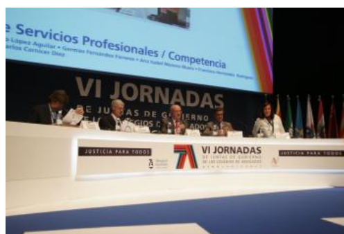
Un momento de la ponencia sobre la Ley de Servicios Profesionales, de la última jornada.

La última sesión de las jornadas de Juntas de Gobierno de los Colegios de Abogados clausuradas en el Auditorio Mar de Vigo estuvo centrada en dos asuntos de máxima preocupación para este colectivo profesional. Por una parte, la Ley de Servicios Profesionales que podría suponer la desaparición de los colegios de abogados y por otra los textos legislativos en trámites de reforma. En ambos asuntos hubo clara oposición.